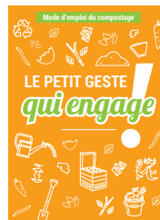
1 mode d'emploi